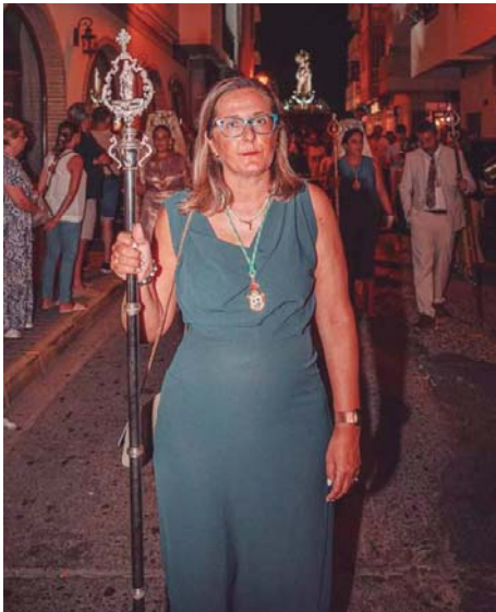
Jimena Donoso, concejala de Festejos de Punta Umbría.