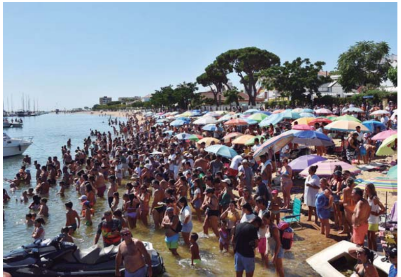
Cientos de personas en la orilla de la ría para ver la cucaña y darse el primer chapuzón de la jornada festiva.