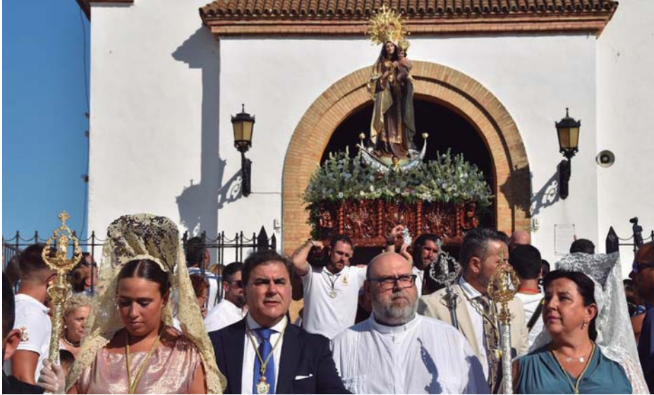
Las autoridades saliendo de la iglesia de Lourdes con el alcalde de Punta Umbría, el párroco local y los representantes de la Hermandad del Carmen.