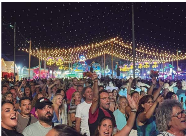
En la imagen, el recinto ferial repleto de público durante una de las actuaciones de la programación de las fiestas.

FERIA EN EL PORTIL Y NUEVO PORTIL _ La oferta de ocio en el mes de agosto se ha completado con la Feria de El Portil y Nuevo Portil, y con el Carnaval de Verano, celebrados solo una semana después de las fiestas del Carmen. En ambos eventos ha destacado la música en directo y, en el caso de la feria, también el día dedicado a los más pequeños. Los ayuntamientos de Punta Umbría y Cartaya han colaborado estrechamente en la organización de la feria, donde la actuación de Fran Cortés, hijo del popular cantaor Chiquetete, fue uno de los platos fuertes.