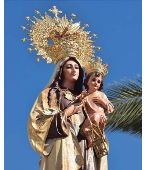
La Alcaldesa Perpetua y Patrona de Punta Umbría, la Virgen del Carmen.