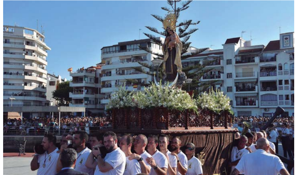
La imagen de la Virgen del Carmen entrando en el muelle de las cañas a hombros de la cuadrilla de costaleros de la Hermandad del Carmen.