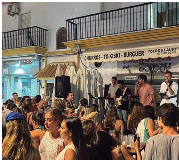
Las principales calles comerciales de la localidad albergaron música en directo y espectáculos musicales con dj's. El ambiente festivo estuvo presente durante la semana, en lugares como la calle Ancha o la plaza Al-Bakri