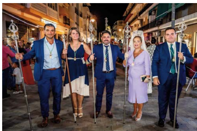
Concejales del equipo de Gobierno (Unidos por Punta Umbría) durante la procesión del 15 de agosto.