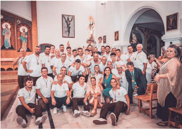
La cuadrilla de costaleros de la hermandad, con la hermana mayor y la presidenta, en la iglesia de Santa María del Mar.