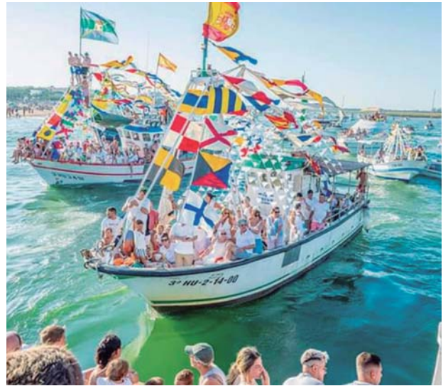
Las familias marineras acompañaron a la patrona a bordo de los barcos de pesca. J.V.