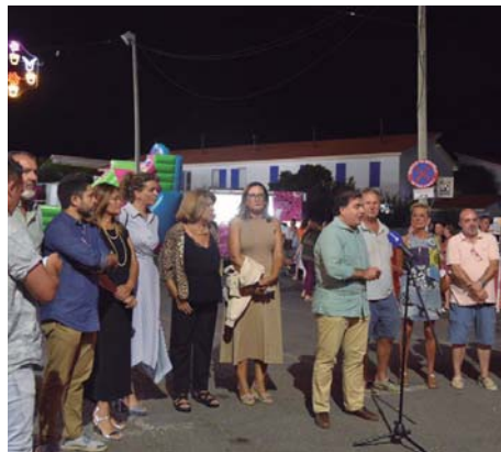
El alcalde y los concejales puntaumbrieños en la Feria de El Portil