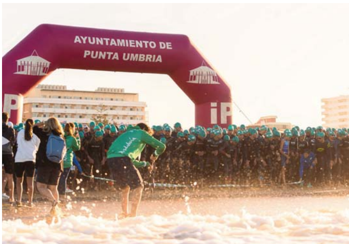
Casi 400 triatletas de diferentes categorías participaron en la edición del año pasado FATRI

El aparcamiento del Punta Mar volverá a ser el epicentro de la prueba, donde se ubica el área de transiciones entre