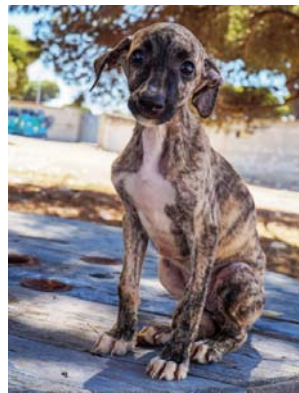
Sand es uno de los cuatro cachorros de galgo que esperan una familia de adopción. Tiene apenas 2 meses y es muy tranquilo. Puedes llamar al 610528802 para conocer a Sand.

Las nuevas instalaciones están diseñadas para acoger inicialmente a unos 80 animales, con la posibilidad de ampliar la capacidad en el futuro. Este entorno mejorado no solo proporcionará un lugar seguro y cómodo para los animales, sino que también contribuirá a su bienestar emocional, ofreciendo un espacio donde puedan jugar y relajarse.