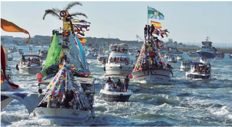
La flota pesquera de la localidad se engalanó para acompañar a su patrona por la ría puntaumbrieña.

LA PATRONA EN PROCESIÓN _ El Día 15 de agosto es uno de los días grandes de la localidad y, en especial, para la marinería de Punta Umbría. La Virgen del Carmen procesionó por la ría puntaumbrieña acompañada por toda una flota de embarcaciones engalanadas para el momento. Miles de carmelitas participaron de las fiestas patronales con grandes muestras de devoción hacia su patrona en el día grande de la localidad. Las coplas a la Virgen del Carmen durante la procesión fueron constantes y el trabajo de los costaleros fue aplaudido por la multitud en las calles. Las mujeres de mantilla dejaron bonitas estampas a lo largo del recorrido, donde se respiró un ambiente de hermandad y fraternidad. La restauración de la Virgen ha sido el gran atractivo de esta temporada festiva.