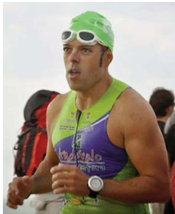
‘Kuki’ no entiende su pasión por el deporte sin compartirla con su familia. Es habitual verlos juntos en las competiciones a las que va

Pero ¿por qué un deporte tan exigente como el triatlón? Él lo tiene claro. “Lo que más me gusta del