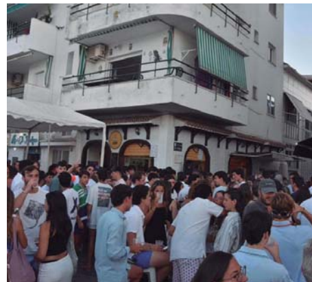
Disfrutando de la Feria de Día en 'Leña', junto a la orilla de la ría.