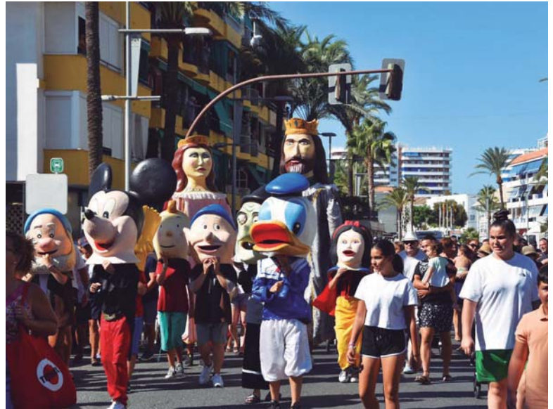
El desfile de gigantes y cabezudos comenzó desde la Avenida de Andalucía y alcanzó el muelle de las canoas a las 12.00 h.

“Para mí es un día muy importante. Es un día de muchas sensaciones. Solemos llegar media hora antes de que los participantes comiencen a inscribirse. A las 12 comenzamos a explicar las normas y cómo hay que coger la bandera para que no haya malos entendidos. La verdad es que lo pasamos muy bien y disfrutamos mucho. Espero que el Ayuntamiento y la Hermandad sigan contando muchos años con nuestra familia y sigamos contribuyendo a enriquecer las fiestas en honor a la Señora del Carmen”, concluye.