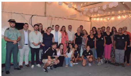
El equipo de Gobierno, de visita a las hermandades de la localidad