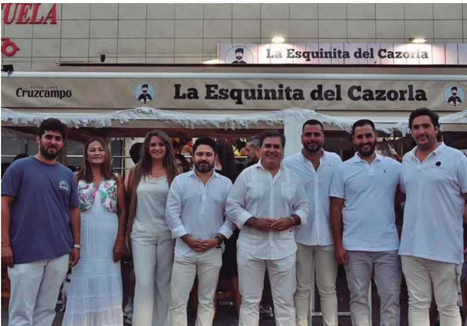
Momento de la inauguración del evento que pone la guinda al pastel del verano en Punta Umbría, "De Punta en Blanco".

De Punta en Blanco despide el mes de agosto a lo grande con conciertos en directo, animaciones en las calles, descuentos en los comercios locales -que abrieron hasta las 3 de la madrugada-, y sorpresas para los que pasearon vestidos de blanco por las calles de nuestro municipio