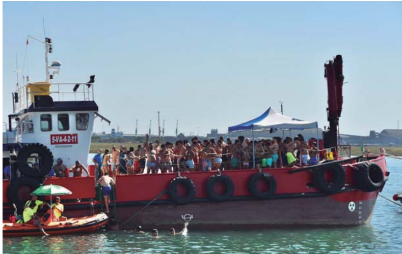
Decenas de concursantes esperaron su turno para intentar capturar una de las banderas de la cucaña