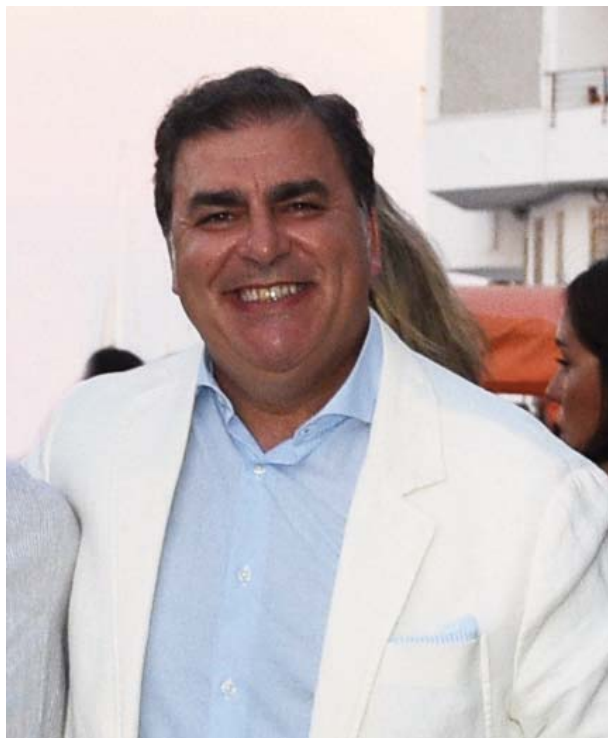
El alcalde de Punta Umbría, José Carlos Hernández Cansino

Por otra parte, “era de justicia que la verbena de la barriada que lleva su nombre resurgiera y brillara como antaño, porque la convivencia entre vecinos y vecinas, en alianza, da más sentido a nuestro pueblo en torno a nuestra Patrona. Las tradiciones hay que cuidarlas y en ello estamos trabajando desde que llegué a la Alcaldía. Quisiera, además, agradecer a la Hermandad de la Virgen del Carmen el trabajo que especialmente este año ha realizado en pos de su devoción” , concluyó Hernández Cansino.