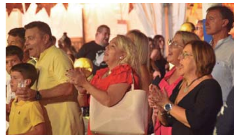
La oferta lúdica de la feria permitió disfrutar con toda la familia.