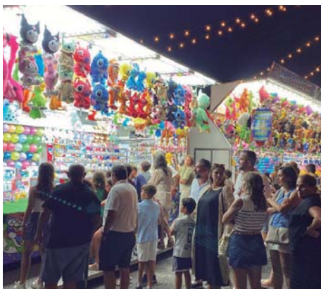
El Día del Niño en El Portil fue todo un éxito en la afluencia de visitas.