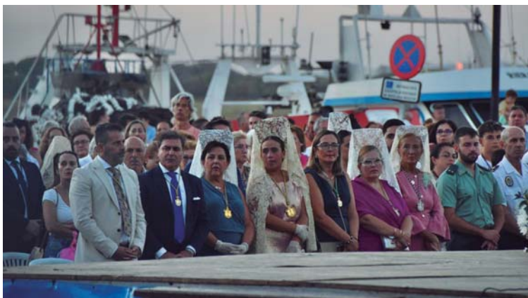
Las autoridades durante la misa oficial en el muelle de la Cofradía, con las autoridades locales y miembros del Carmen.

“El objetivo es diversificar nuestra propuesta turística, ofreciendo una alternativa a la oferta de sol y playa que ha sido siempre el motor turístico de la localidad. La Feria de Día, con una amplia oferta de ocio y musical, ha sido una de las novedades en este sentido, durante las fiestas patronales”.