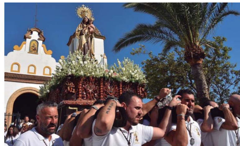
Los costaleros portan a la patrona a la salida de la Iglesia de Lourdes, antes de bajar en dirección a la ría.